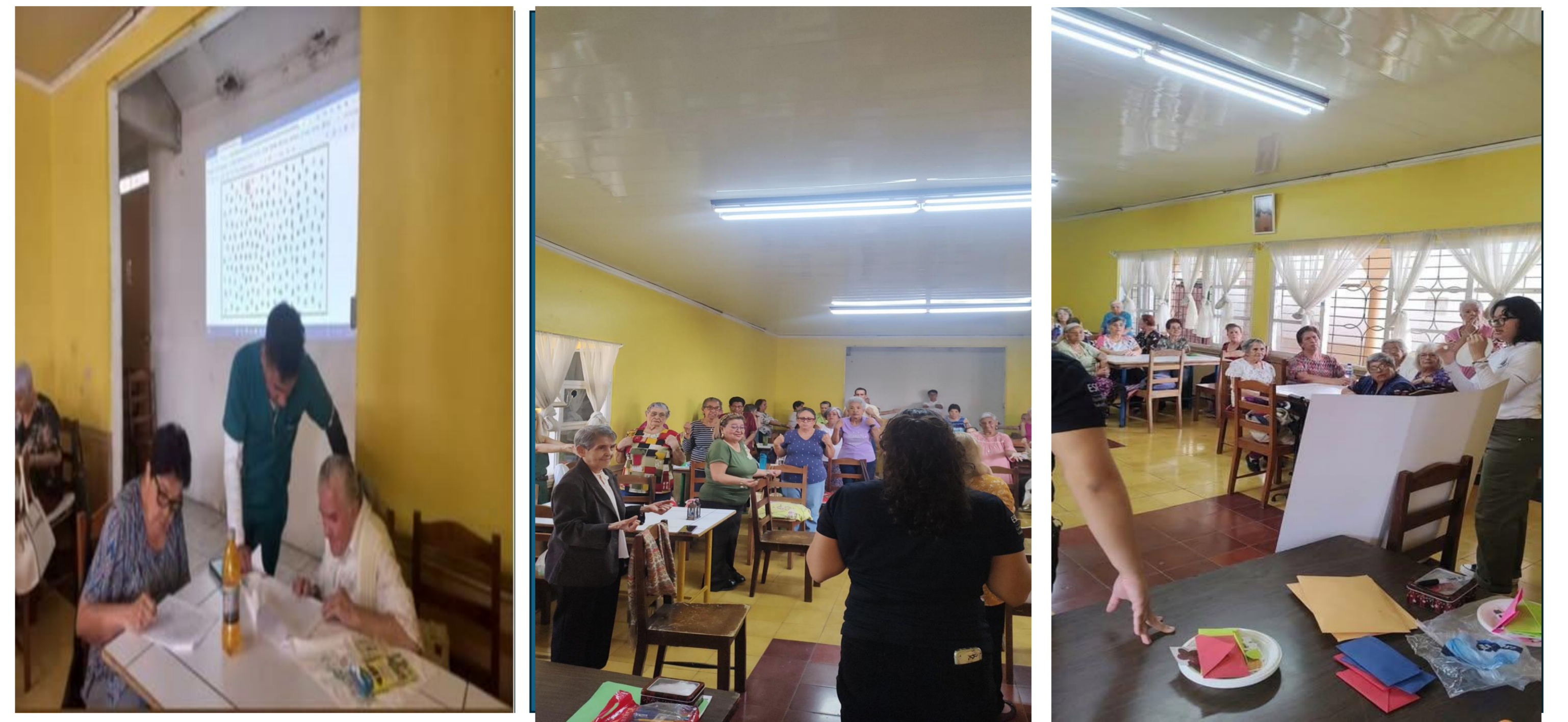
Fotos de las sesiones educativas.

Se desarrolló un proyecto educativo participativo entre septiembre y noviembre de 2024, con 8 sesiones semanales que abordaron alimentación saludable, estimulación cognitiva, actividad física y estilos de vida saludables. La población estuvo compuesta por 40 adultos mayores, en su mayoría mujeres de 65 a 94 años. Se aplicaron instrumentos diagnósticos, sesiones con plantillas educativas, pre-test y post-test, además de actividades prácticas adaptadas a las condiciones del grupo. Plantillas educativas es un modelo educativo centrado en lo que la persona va a aprender, no en lo que el docente va a enseñar.