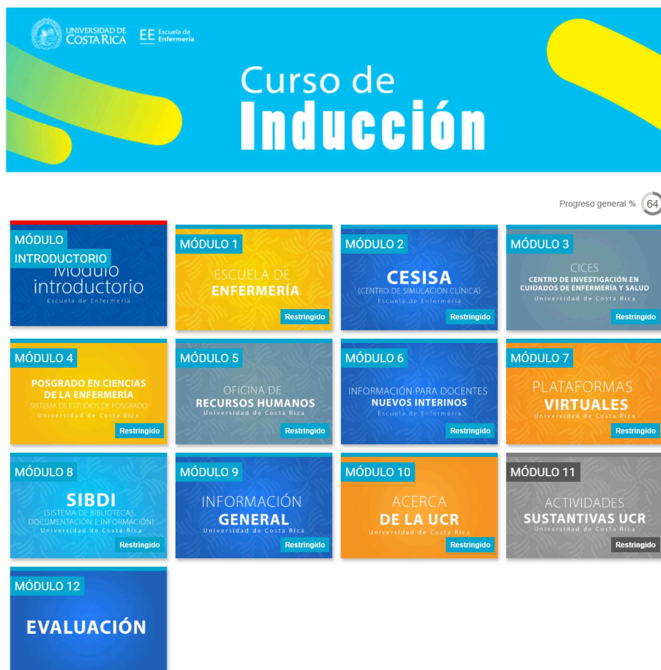
Figura 1. Capturas del curso Autogestionado en la plataforma virtual moodle, 2025

La incorporación de nuevos docentes a la Escuela de Enfermería planteaba desafíos pedagógicos y organizativos, como el desconocimiento de la filosofía institucional, del currículo y de metodologías innovadoras. Además, el personal provenía de contextos profesionales diversos, lo que dificultaba la integración de teoría y práctica.