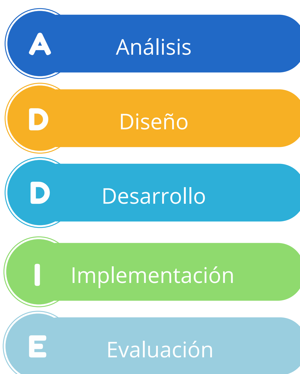
Figura 2. Diseño instruccional ADDIE

Para su desarrollo se utilizó el modelo de diseño instruccional ADDIE (análisis, diseño, desarrollo, implementación y evaluación). Estuvo a cargo de un equipo interdisciplinario compuesto por: expertos en procesos de virtualización, diseño gráfico y desarrollo de materiales audiovisuales, docentes de Enfermería y de otras instancias de la Universidad que aportaron la parte teórica y sistemática de los procesos.